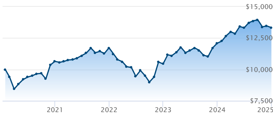
FINB BMO MSCI EAFE ESG Leaders (ESGE)

Le rendement passé n'est pas garant des résultats futurs. Les taux de rendement indiqués sont les taux de rendement composés annuels historiques globaux et tiennent compte de l'évolution des rendements et du réinvestissement des distributions. Dans le cadre des comptes indiciels gérés, des comptes indiciels de portefeuilles gérés et des comptes indiciels en fonction du marché, des intérêts qui reflètent le rendement net d'un placement sous-jacent déterminé sont crédités, moins les frais de gestion quotidiens de BMO Société d'assurance-vie. Ces taux de rendement ne tiennent pas compte des frais de gestion actuels de BMO Société d'assurance-vie ou des frais actuels de polices d'assurance vie universelle, qu'il faut inclure pour le calcul du rendement net obtenu sur le compte.