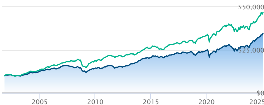
Catég d'excellence équilibrée can Invesco série A Indice équilibré canadien Fundata

Les renseignements qui figurent ici ne concernent que les fonds désignés dont le nom figure ci-dessus. Le titulaire d'une police de BMO Société d'assurance-vie n'achète ni part de ce fonds désigné ni intérêt juridique dans aucun titre.