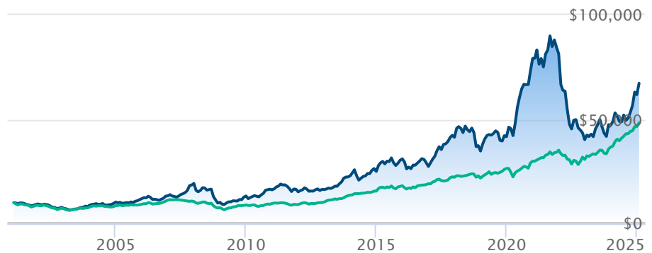
Catégorie Croissance mondiale Power Dynamique A Dow Jones Global TR Index ($C)

Les renseignements qui figurent ici ne concernent que les fonds désignés dont le nom figure ci-dessus. Le titulaire d'une police de BMO Société d'assurance-vie n'achète ni part de ce fonds désigné ni intérêt juridique dans aucun titre.