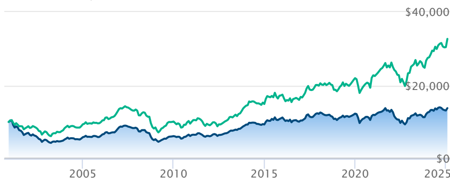
Catégorie d'actions européennes BQÉ Invesco A Dow Jones Europe TR Index (C$)

Les renseignements qui figurent ici ne concernent que les fonds désignés dont le nom figure ci-dessus. Le titulaire d'une police de BMO Société d'assurance-vie n'achète ni part de ce fonds désigné ni intérêt juridique dans aucun titre.